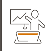
Individuelle Aus- und Weiterbildungen