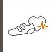
Gesundheitsmaßnahmen und Sportevents