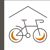
Fahrradkeller und Duschkmöglichkeit