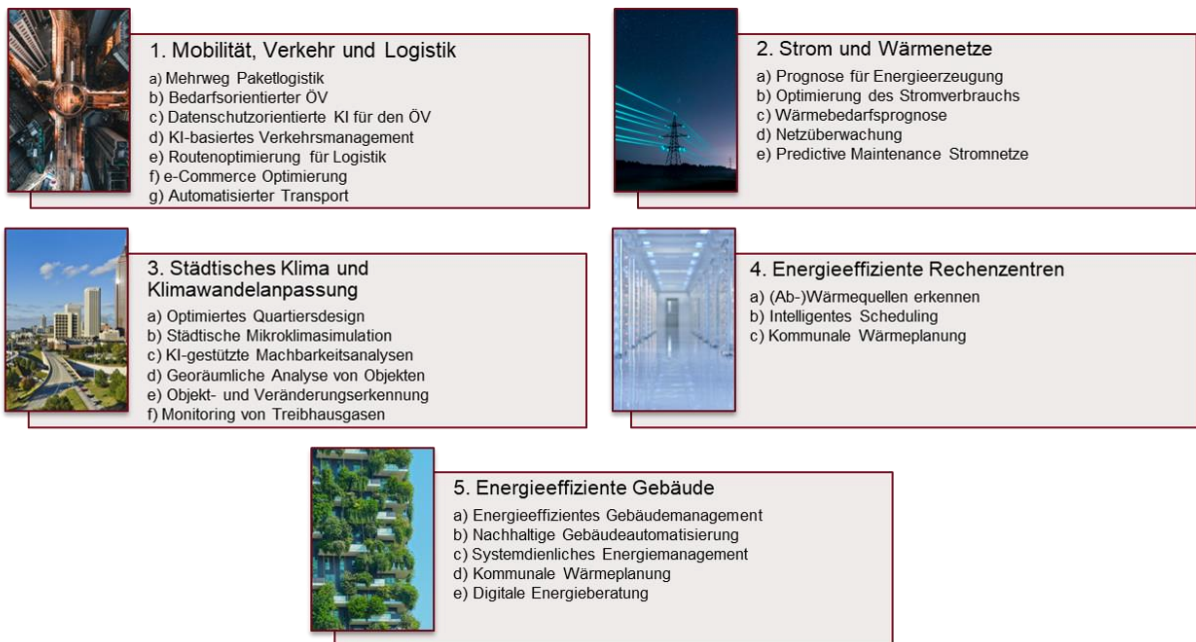
Abbildung 5: Anwendungsfelder von cityclimAlte: Mobilität&Logistik, Strom und Wärmenetze, Städtisches Klima und Klimawandelanpassung, Energieeffiziente Gebäude, Energieeffiziente Rechenzentren.

Im Rahmen des Projekts cityclimAlte konnten wesentliche Erkenntnisse zu den Potenzialen von KI-Anwendungen im urbanen Klimakontext erarbeitet werden. Die Ergebnisse basieren auf einer umfassenden Umfeldanalyse, der systematischen Identifikation und Bewertung von KI-Use-Cases sowie der Analyse technologischer, organisatorischer und gesellschaftlicher Rahmenbedingungen.