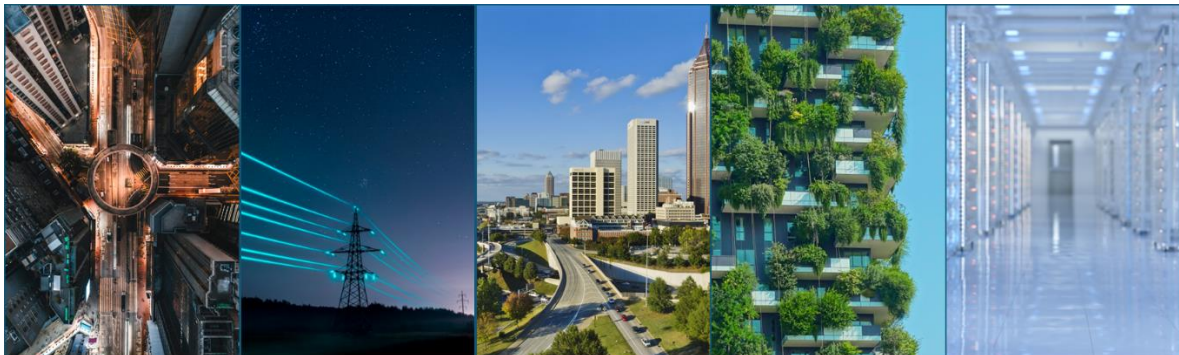
Abbildung 4: Anwendungsfelder von cityclimAlte: Mobilität&Logistik, Strom und Wärmenetze, Städtisches Klima und Klimawandelanpassung, Energieeffiziente Gebäude, Energieeffiziente Rechenzentren.

Die Analyse der KI-Anwendungsbereiche baut unmittelbar auf dem Screening auf und verdichtet die dort erhobene Anwendungsfälle zu einem belastbaren Bild derjenigen Domänen, in denen KI zur Klimaneutralität beiträgt. Ausgangspunkt war eine fachliche und methodische Rahmung mit klaren Bewertungsdimensionen: Klimawirkung, Machbarkeit und Komplexität/Umfang. Eine Definition und Abgrenzung dieser Begriffe zueinander findet sich in den Abschnitten 4.4.1 und 4.4.2. Parallel zu diesen Dimensionen wurden rechtliche und ethische Aspekte, Datenanforderungen und Reifegrade (TRL) mitgeführt, um nicht nur technologische Möglichkeiten, sondern auch Umsetzungspfad, Governance und Risiken abbilden zu können.