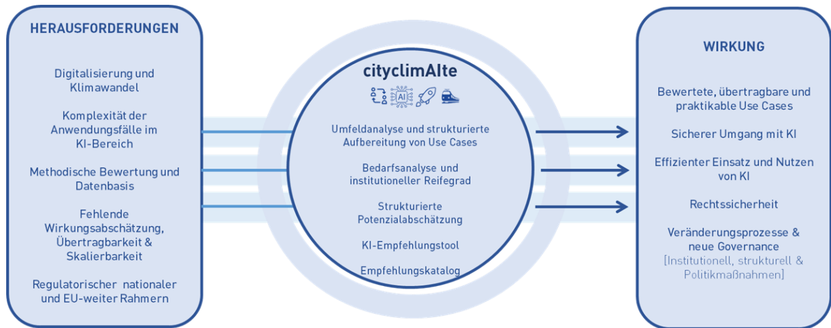
Abbildung 1: Projektüberblick mit Motivation und Wirkung von cityclimAlte.

Daraus leiten sich folgende Teilziele ab, die in diese Studie berücksichtigt werden: